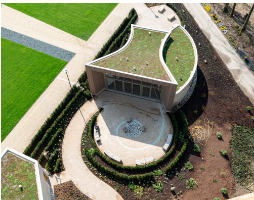
Der auf Basis nachhaltiger Prinzipien konzipierte Pavillon überzeugt durch seine organische Form und bildet das Entree für den Baumwipfelpfad.

Im Fokus der Konstruktion stehen umwelt- und klimaschonende Aspekte – damit passt der Einsatz des Holzfassadensystems von Osmo bestens ins Konzept. Ausschlaggebend für das große Engagement des Holzspezialisten waren sowohl die besondere Form des Bauwerks und dessen gelungene Integration in die Umgebung als auch der lokale Bezug, Bad Iburg liegt kaum 30 Kilometer von Warendorf entfernt. Das Fassadensystem VERTO wurde speziell für die vertikale Montage entwickelt und erlaubt große Freiheiten im Bereich der individuellen Ausdrucksmöglichkeiten. Die Profile werden senkrecht angebracht und variieren in ihren