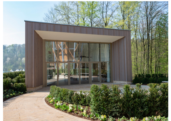
Der TERRA.vita-Pavillon ist eines der Highlights der diesjährigen Landesgartenschau Bad Iburg. Beim Bau kam auch das innovative Fassadensystem VERTO von Osmo zum Einsatz.

Der Warendorfer Spezialist für Holz und Farbe hat den Architekten für die Realisierung des TERRA.vita-Pavillons, dem Beitrag des gleichnamigen Natur- und Geoparks zur LaGa, als Sponsor sein innovatives Holzfassadensystem VERTO zur Verfügung gestellt. Das Informationszentrum klärt Besucher über das bedeutende geologische Erbe der Region auf und stellt schon in seiner Außenanlage einen deutlichen Bezug zur dortigen Natur- und Kulturlandschaft her. Der organisch geformte Pavillon aus heimischen Materialien fungiert zudem als Entree des Baumwipfelpfades und symbolisiert den Lebenslauf der Erde und die Entstehung des Lebens.