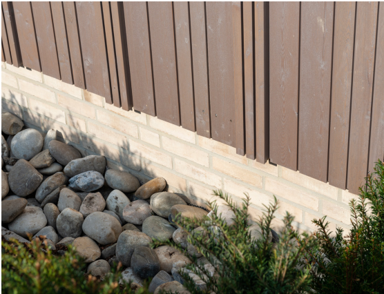
Speziell für die vertikale Montage entwickelt erlaubt das Fassadensystem VERTO große Freiheiten im Bereich der individuellen Ausdrucksmöglichkeiten.

Breiten, Tiefen und Farbtönen. Sie sind in vier Dimensionen verfügbar, sodass sich aus den Profilen zahlreiche Kombinationen ergeben. Je nach Zusammenstellung werden beispielsweise dreidimensionale Effekte erzeugt – besonders ausdrucksstark ist der Wechsel von Profilen unterschiedlicher Stärke. In Bad Iburg kommen riffelgesägte VERTO Profile aus sibirischer Lärche zum Einsatz, die dank der Behandlung mit der Osmo Holzschutz Öl-Lasur Effekt Achatsilber in besonderer Optik erstrahlen. Die klaren Linien und die moderne Optik von VERTO kommen am TERRA.vita-Pavillon sehr gut zur Geltung und runden das bemerkenswerte Bauwerk perfekt ab. Das Thema Nachhaltigkeit setzt sich – ganz im Einklang mit der Osmo Unternehmensphilosophie – auch